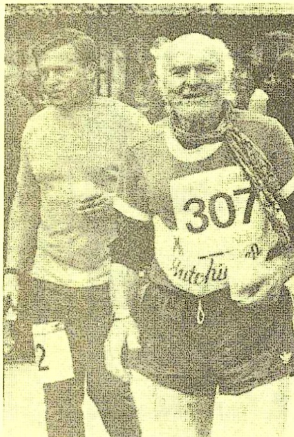
73 ans, bien sonnés, et une condition physique exemplaire!